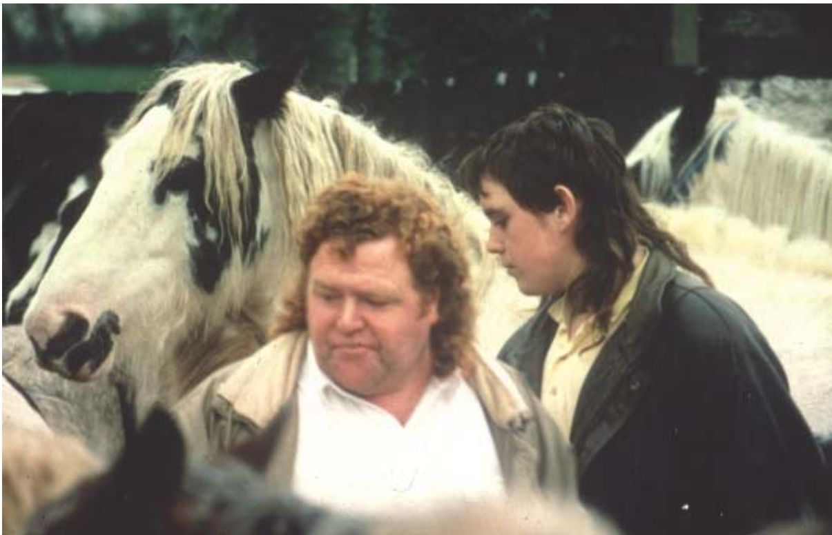
Pferdemarkt in Ballinasloe (Irland)